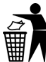
適切な廃棄をこころがけましょう。

(2) 絵表示の色は、高い視認性が得られるよう、背景とのコントラストが十分に高くなければならない。表示場所は問わない。